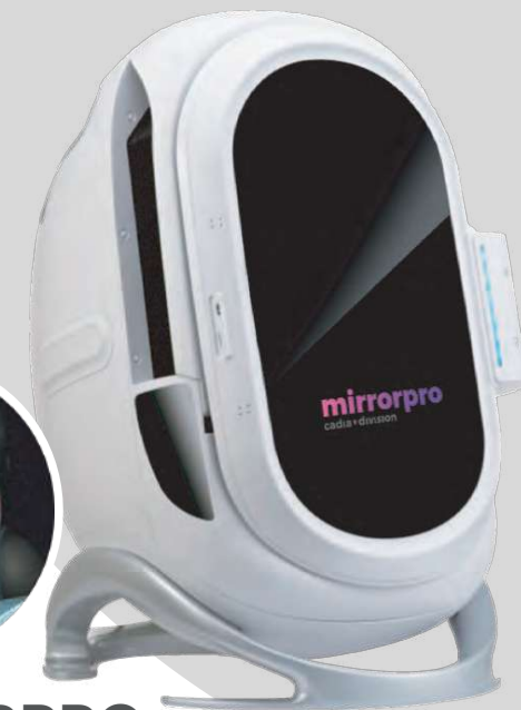
MIRRORPRO Cámara de diagnóstico facial