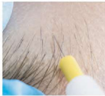
Aumento Optimizion en imagen: 42 x (120 dioptrías)